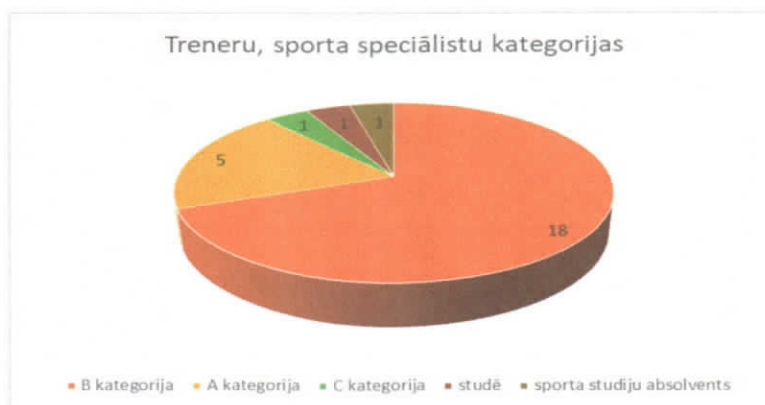
Att.1 Treneru, sporta speciālistu kategorijas

„B” kategorijas sporta speciālista sertifikātu saņēmēji 18 treneri. „C” kategorijas sporta speciālista sertifikātu saņēmis 1 treneris. Sporta studiju absolvents 1 treneris. 1 treneris studē LSPA.