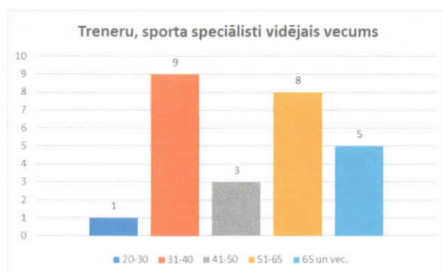
Att.2 Treneru, sporta speciālistu vidējais vecums

Jaunajiem speciālistiem, uzsākot darbu skolā, lielu atbalstu sniedz pieredzējušie treneri – tiek organizēti koptreniņi, notiek pieredzes apmaiņa.